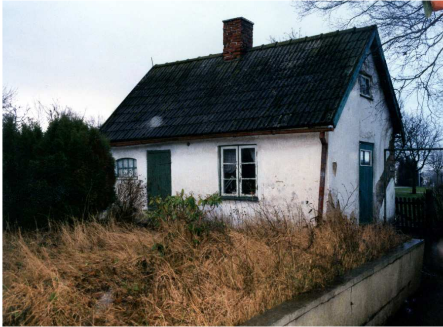
Ett par bilder som Sture och Evy Nilsson har tagit. Från rivningen av huset.