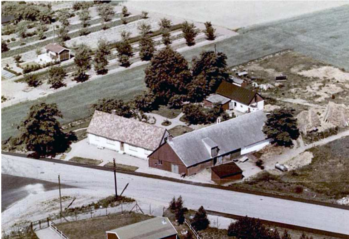
Så här såg gården Dalby 37:42 ut i mitten på 1950-talet.