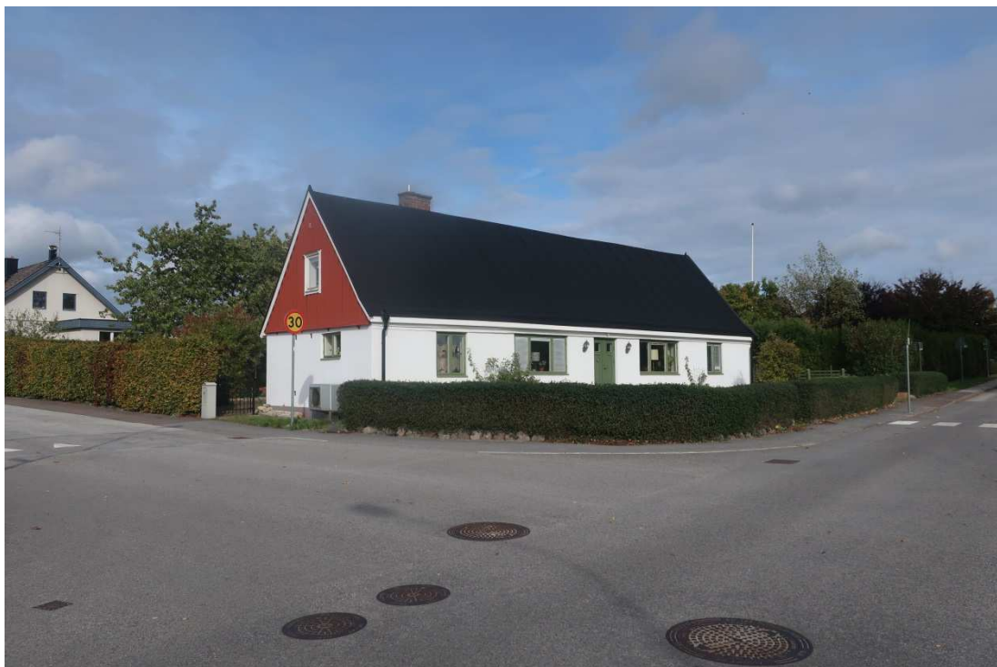
Så här ser det fina boningshuset ut i dag, adress Villavägen 2.