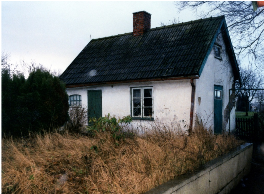
Ett par bilder som Sture och Evy Nilsson har tagit. Från rivningen av huset.